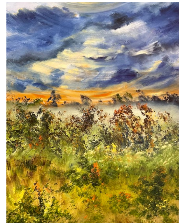
Начало осени. 2022. Холст, масло. 80x60