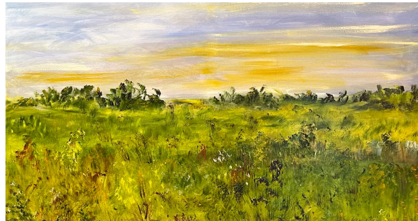
Опять осень. Начало. 2022. Холст, масло. 50x80

сторон, как именно буду писать, мазки, приемы, не более того... Работаю ночью с позднего вечера, тишина, запах масла — это настоящее наслаждение, работа идет!»