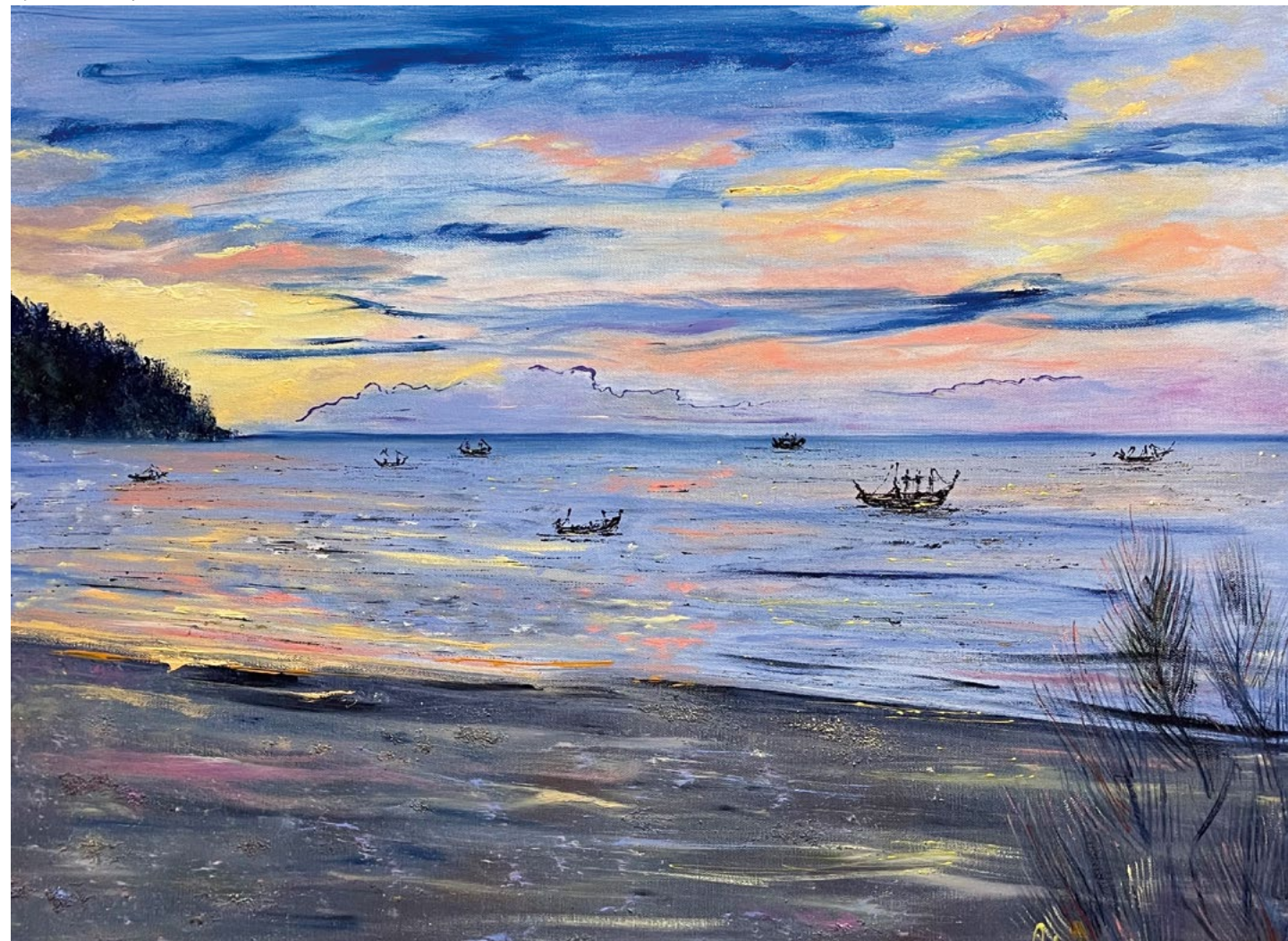
Пустынный берег. 2022. Холст, масло. 60x80