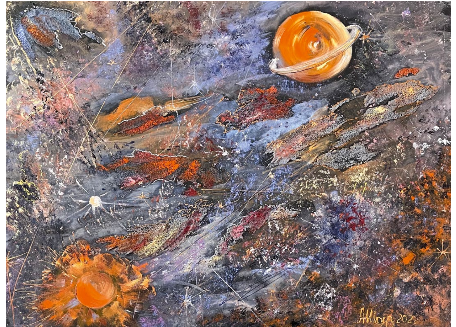
Прозрачная пространство и время. 2022. Холст, масло. 60x80